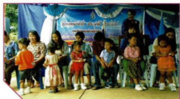
กิจกรรมวันแม่แห่งชาติ