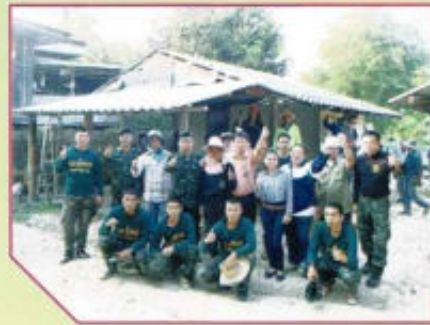
โครงการปรับปรุงซ่อมแซมบ้าน ให้แก่ผู้พิการ