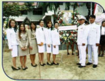
ร่วมกิจกรรมวันปิยะมหาราช