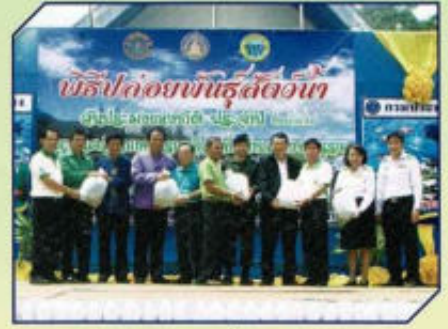
พิธีปล่อยพันธุ์สัตว์น้ำ ร่วมกับ ประมง จ.พะเยา