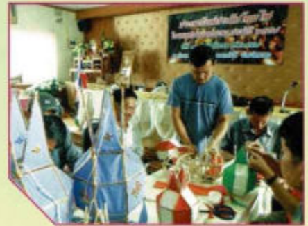
ประเพณีแห่ประทีปโคมไฟ