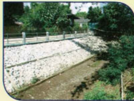
ก่อสร้างพนังกั้นน้ำ (คสล.) ลำห้วยดง