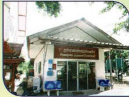
ปรับปรุงอาคารสำนักงาน อบต.ดงสุวรรณ