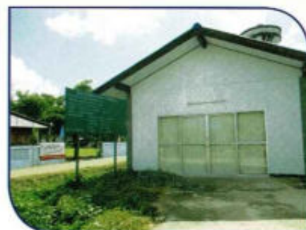
ปรับปรุงศูนย์อาสาสมัครป้องกันภัย ฝ่ายพลเรือน (อปพร.)