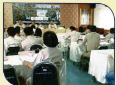
ประชุมสภา อบต.ดงสุวรรณ