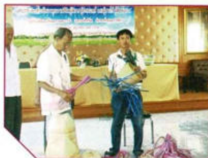
ส่งเสริมพัฒนาคุณภาพชีวิตผู้พิการ ผู้ป่วยเอดส์ ผู้ยากไร้ และผู้ด้อยโอกาส