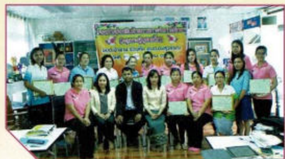
โครงการส่งเสริมศักยภาพการจัดการศึกษา (ครูผู้ดูแลเด็ก)