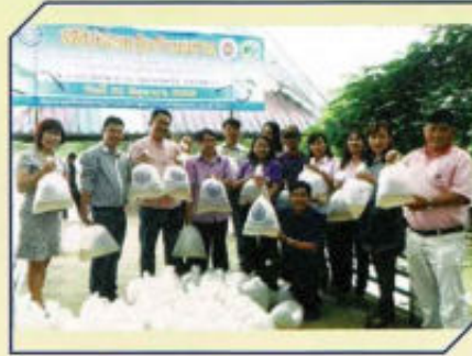
พิธีปล่อยถังกำกวม ร่วมกับ ประมง จ.พะเยา