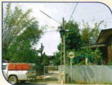
บำรุงซ่อมแซมไฟฟ้าส่องสว่าง