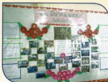
กิจกรรมวันท้องถิ่นไทย