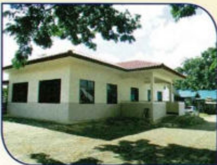
ก่อสร้างอาคารศูนย์พัฒนาเด็กเล็ก