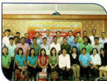
อบรมความรู้ พ.ร.บ.ข้อมูลข่าวสาร