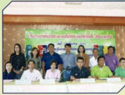
โครงการอบรมคัดแยกขยะมูลฝอย