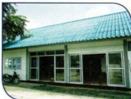
ปรับปรุงร้านค้าชุมชน ตำบลดงสุวรรณ