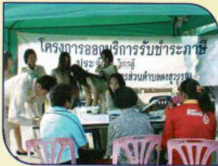
บริการรับชำระภาษีเคลื่อนที่