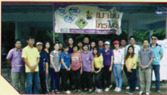
อบรมเครือข่ายตำบลสุขภาวะ