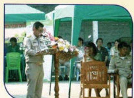
อบต.สั่งจรรยาพบประชาชน