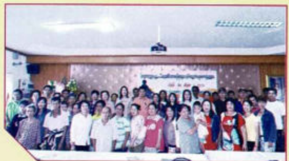
อบรมพัฒนาศักยภาพผู้ดูแลคนพิการ ตำบลดงสุวรรณ