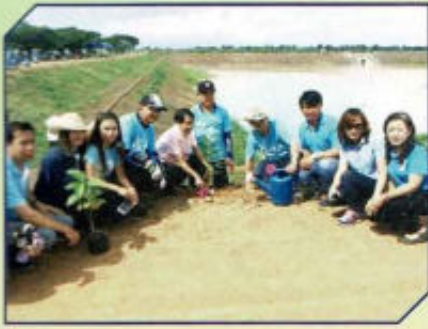
ปลูกป่าและปลูกหญ้าแฝก เฉลิมพระเกียรติ