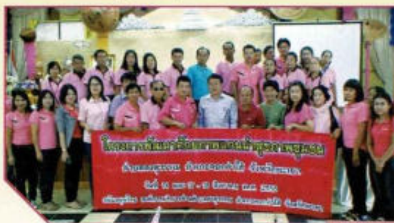
โครงการพัฒนาศักยภาพแกนนำสุขภาพชุมชน