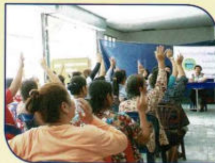
ประชามเพื่อจัดทำแผนพัฒนา