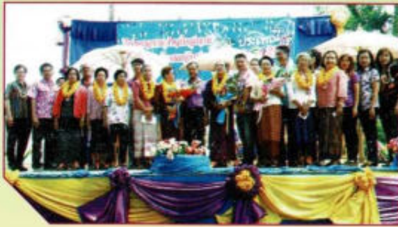
ประเพณีสงกรานต์รดน้ำดำหัวผู้สูงอายุ