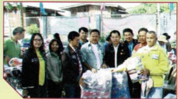
มอบเครื่องท่่มกันหนาวร่วมกับ อบจ.พะเยา