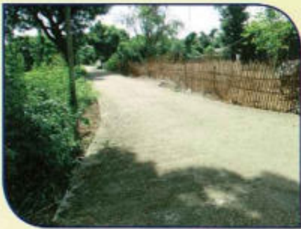
ก่อสร้างถนนคอนกรีตเสริมเหล็ก (คสล.)