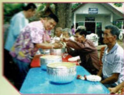
ประเพณีสงกรานต์ รดน้ำดำหัวผู้สูงอายุ