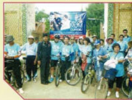
กิจกรรมปั่นเพื่อแม่