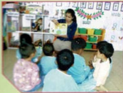
โครงการเลี้ยงดูเด็กปฐมวัย