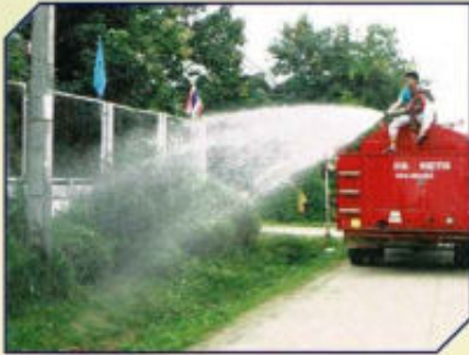
กิจกรรมวันรักต้นไม้แห่งชาติ