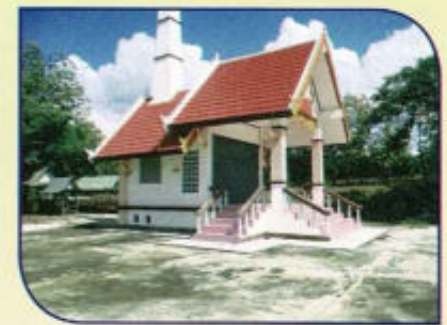
ก่อสร้างลาน คสล.สุสาน หมู่ 6