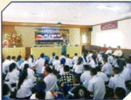
โครงการป้องกันแก้ไขปัญหายาเสพติด