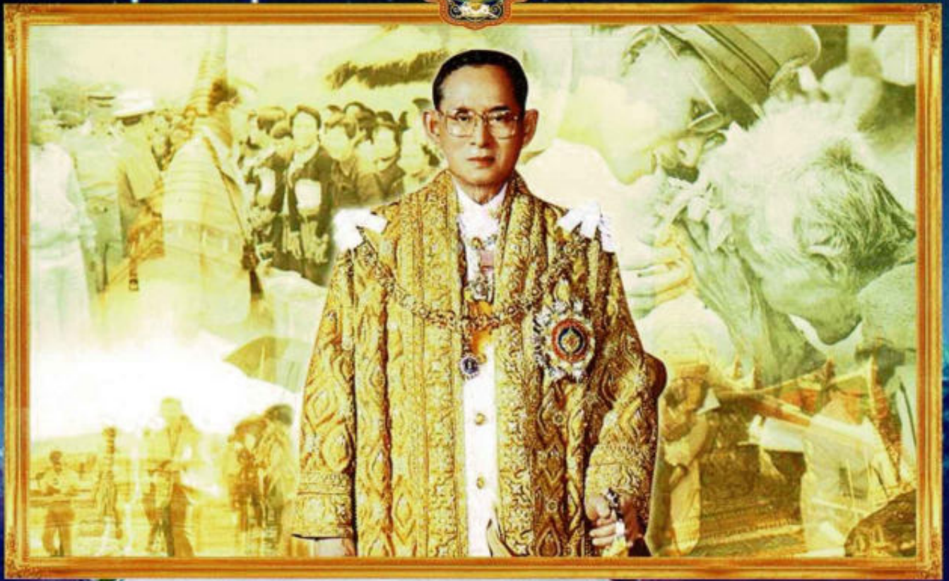
ขอพระองค์ทรงพระเจริญ