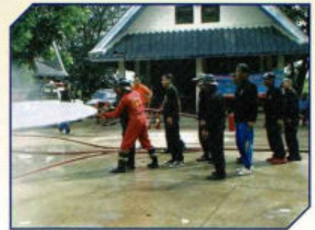
ฝึกอบรมเพิ่มประสิทธิภาพการปฏิบัติงาน อาสาสมัครป้องกันภัยพลเรือน