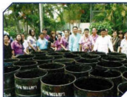
รับมอบถังน้ำ อบจ.พะเยา บรรเทาภัยแล้ง