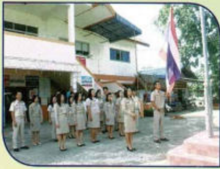
กิจกรรมเช้าแถวเคารพธงชาติ