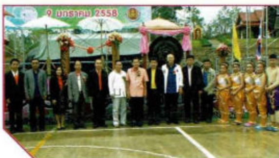
กิจกรรมวันเด็กแห่งชาติ