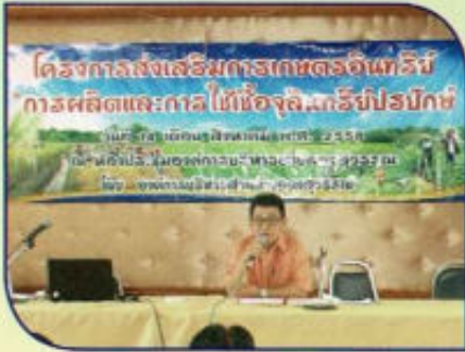
โครงการเกษตรกรอินทรีย์