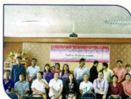
อบรมความรู้ทางกฎหมาย