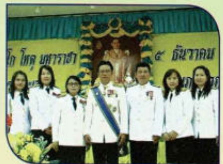
ร่วมกิจกรรมวันพ่อแห่งชาติ