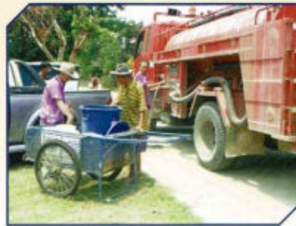
บริการน้ำอุปโภคบริโภค