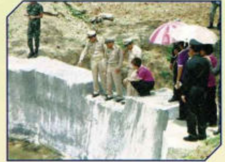
ร่วมโครงการ 60 ฝ่าย 60 หลัง