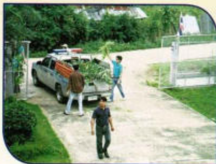
ปรับปรุงภูมิทัศน์ สำนักงาน