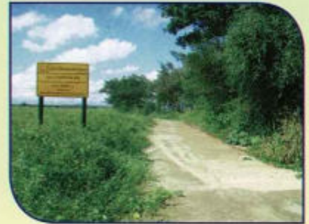
ก่อสร้างถนน คสล.หมู่ 4 บ้านดงใหม่ (งบ อบจ.พะเยา)