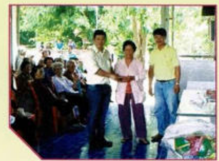
มอบเบี้ยยังชีพ