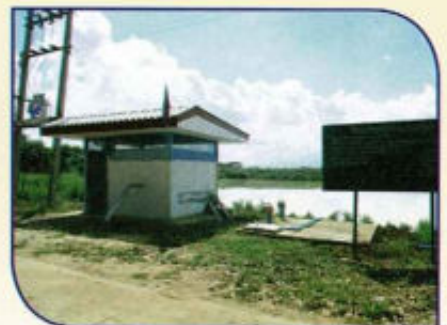
ปรับปรุงระบบประปา ตำบลดงสุวรรณ