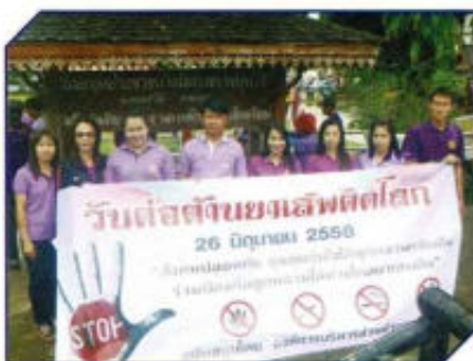
รณรงค์ต่อต้านยาเสพติด