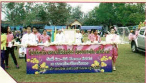
เจ้าภาพจัดการแข่งขันกีฬาท้องถิ่น ดอกคำใต้สัมพันธ์