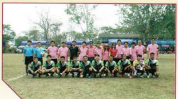
เจ้าภาพจัดการแข่งขันกีฬาท้องถิ่น ดอกคำใต้สัมพันธ์