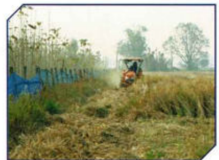
สร้างแนวกันไฟฟ้า