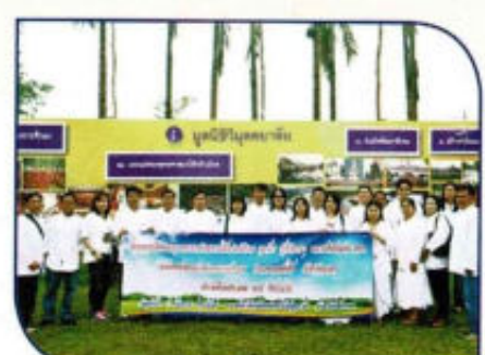
อบรมคุณธรรมจริยธรรม ให้กับพนักงาน