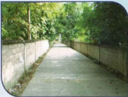
ก่อสร้างถนน คสล. หมู่ที่ 1