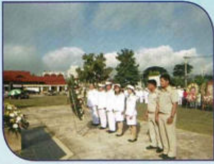
ร่วมงานวันปิยมหาราช