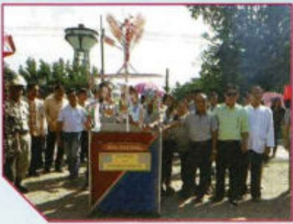
งานสลากภัตตร