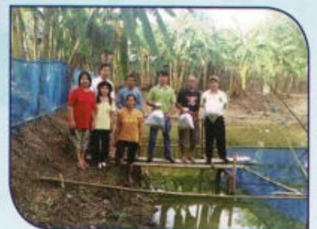
พัฒนาด้านเศรษฐกิจพอเพียง และแหล่งเรียนรู้