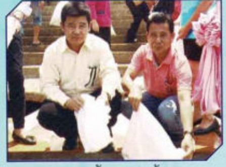
อนุรักษ์พันธุ์สัตว์น้ำอ่างเก็บน้ำหนองขาว