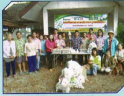
โครงการอบรมคัดแยกขยะมูลฝอย