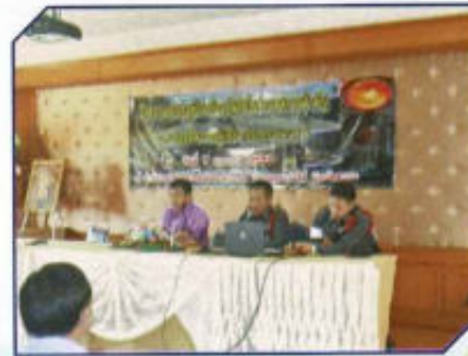
รณรงค์ป้องกันอุบัติเหตุในช่วงเทศกาล สงกรานต์