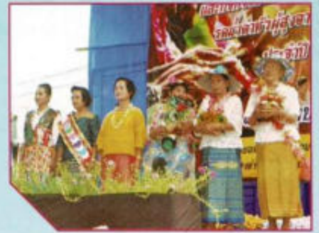
งานประเพณีสงกรานต์รดน้ำดำหัว ผู้สูงอายุ