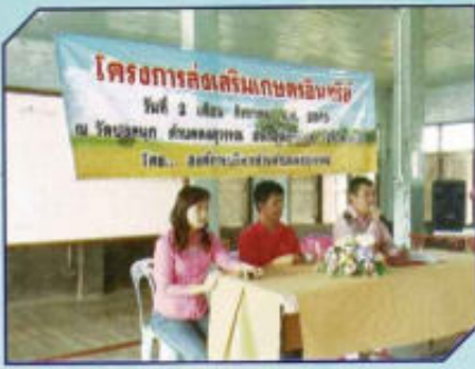
โครงการส่งเสริมเกษตรอินทรีย์