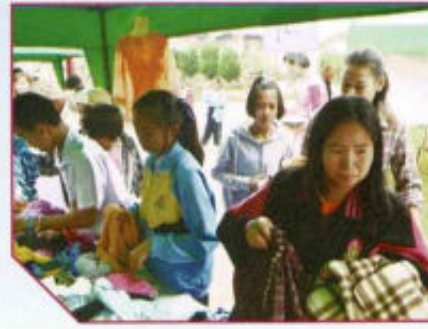
กาดนัดเอื้ออาทร เพื่อพี่น้องตำบลดงสุวรรณ