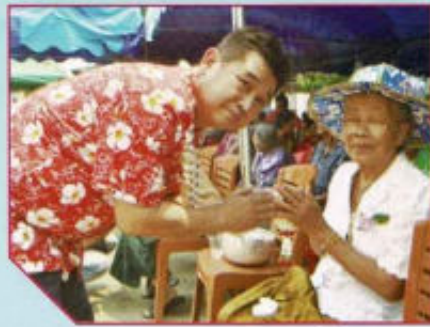
งานประเพณีสงกรานต์รดน้ำดำหัว ผู้สูงอายุ