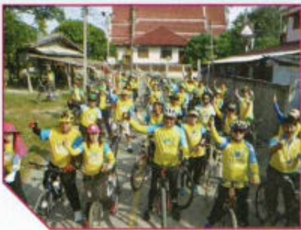
ปั่นจักรยานเพื่อสุขภาพ Bike for Dad