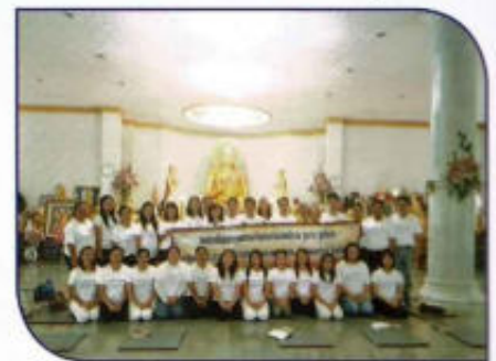
อบรมคุณธรรมจริยธรรม