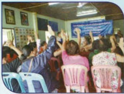
โครงการเวทีประชาคมหมู่บ้าน