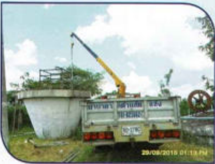
ปรับปรุงระบบประปาหมู่บ้าน หมู่ที่ 7