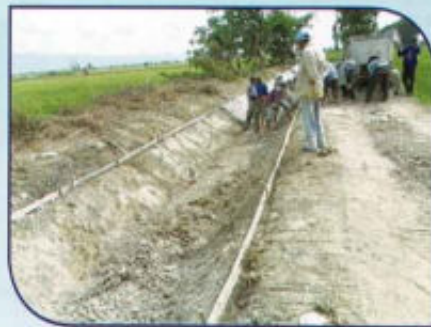
ซ่อมแซมสถานีสูบน้ำด้วยไฟฟ้า