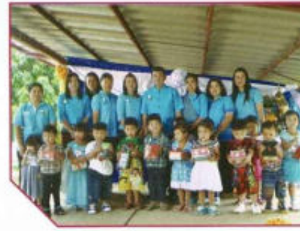
กิจกรรมวันแม่แห่งชาติ