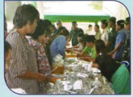
โครงการ อบต.สัญจร พบประชาชน