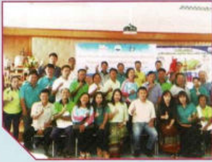
โครงการเสริมพลังเครือข่ายชุมชนท้องถิ่น จัดการตนเองสู่สังคมน่าอยู่ (สสส.)