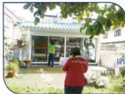
ออกสำรวจแผนที่ภาษี