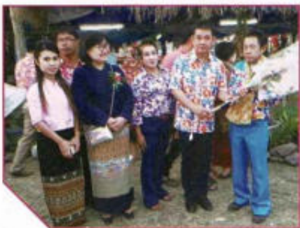
ร่วมงานดอกคำใต้เมืองคนงาม