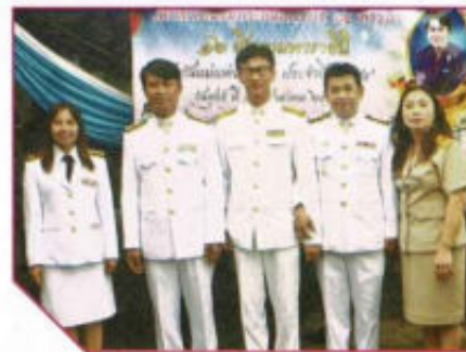
ร่วมพิธีเฉลิมพระเกียรติสมเด็จพระนางเจ้าฯ พระบรมราชินีนาถ