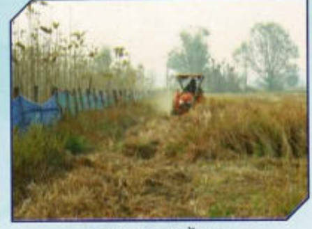
สร้างแนวกันไฟป่า