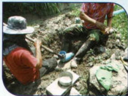
ปรับปรุงซ่อมแซมประปา