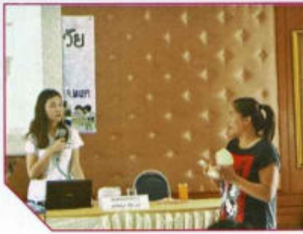
โครงการอบรมเลี้ยงดูเด็กปฐมวัย