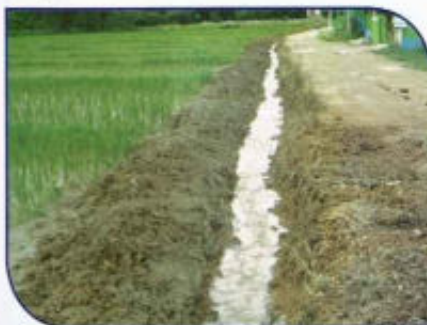
ขุดรางระบายน้ำพร้อมวางท่อ ระบายน้ำ