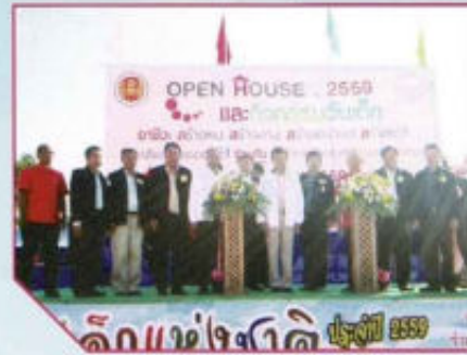
กิจกรรมวันเด็กแห่งชาติ