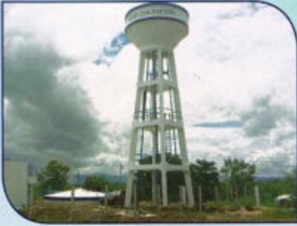
ก่อสร้างระบบประปาหมู่บ้าน แบบผิวดินขนาดใหญ่มาก