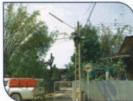
งานบำรุงซ่อมแซมไฟฟ้า ส่องสว่าง