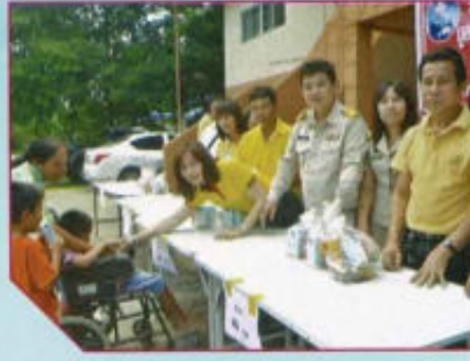
แจกถุงยังชีพ เพื่อช่วยเหลือผู้ประสบอุทกภัย