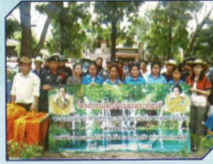
ปลูกป่าเฉลิมพระเกียรติ