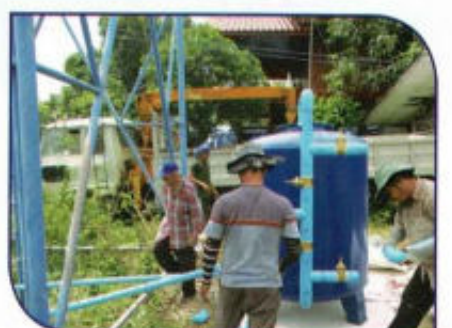
ปรับปรุงระบบประปาหมู่บ้าน หมู่ที่ 6