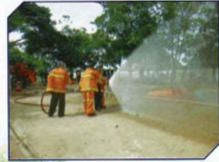
อบรม อปพร.