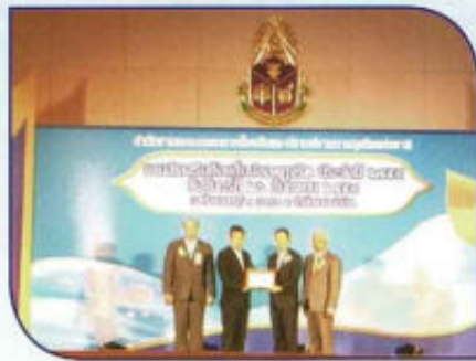
รับรางวัล อบท. ที่ดี ด้านการป้องกัน การทุจริต จากสำนักงาน ปปช.