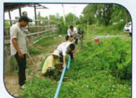
ปรับปรุงระบบประปาหมู่บ้าน หมู่ที่ 10