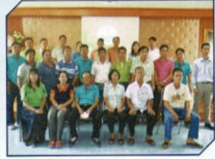
ศูนย์คุ้มครองสิทธิ และช่วยเหลือ ประชาชน อบต.ดงสุวรรณ