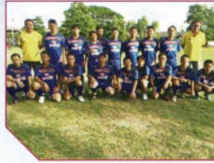
ส่งเสริมการแข่งขันกีฬา