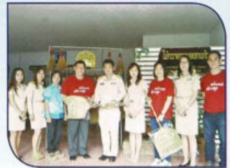
สสส.ลงพื้นที่เยี่ยมชมผลการ ดำเนินงานเครือข่ายตำบลสุขภาวะ