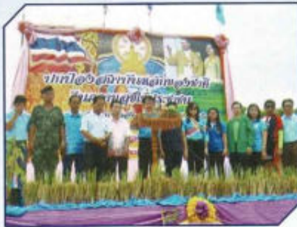
กิจกรรมเสริมสร้างความปรองดอง สมานฉันท์คืนความสุขให้ประชาชน