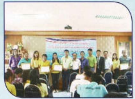
โครงการรักษาดีถูกทาง สร้างเสริมความซื่อสัตย์สุจริต