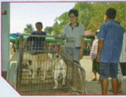
โครงการป้องกันควบคุมโรคพิษสุนัขบ้า