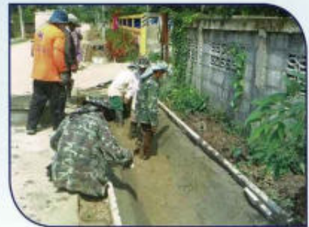
ก่อสร้างรางระบายน้ำ คสล. หมู่ที่ 2