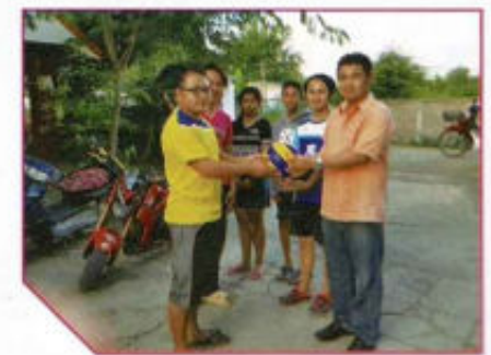
สนับสนุนอุปกรณ์กีฬาแก่เยาวชน