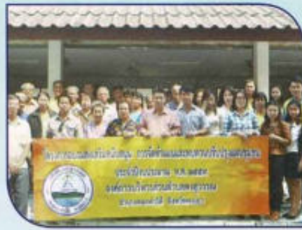
โครงการจัดทำแผนและทบทวน ปรับปรุงแผนชุมชน