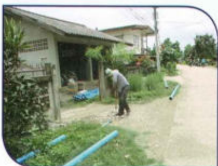
ปรับปรุงระบบประปาหมู่บ้าน หมู่ที่ 3