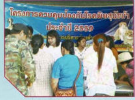
โครงการป้องกันควบคุมโรคพิษสุนัขบ้า ประจำปี 2559