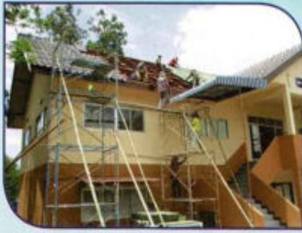
ปรับปรุงอาคารสำนักงาน