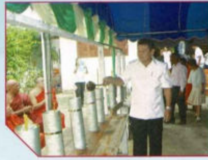
โครงการหล่อเทียนพรรษา