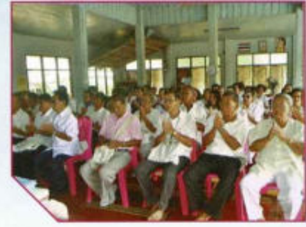
กิจกรรมโรงเรียนผู้สูงอายุอบรมอาชีพแก่ผู้สูงวัย