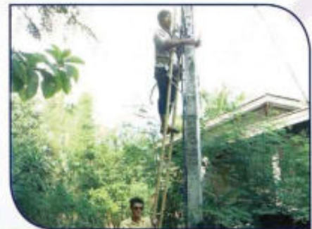
งานบำรุงซ่อมแซมไฟฟ้าส่องสว่าง