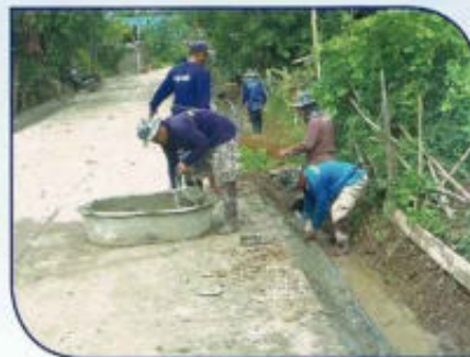
ก่อสร้างรางระบายน้ำ คสล. หมู่ที่ 11