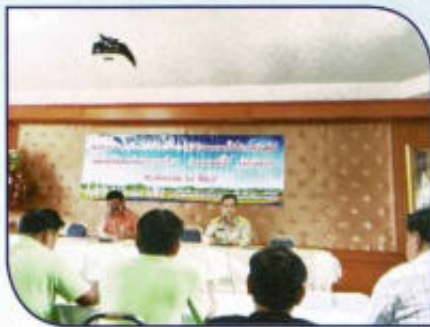
โครงการอบรมเพิ่มประสิทธิภาพ ในการปฏิบัติงาน