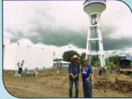
ก่อสร้างระบบประปา อ่างเก็บน้ำหนองขวาง