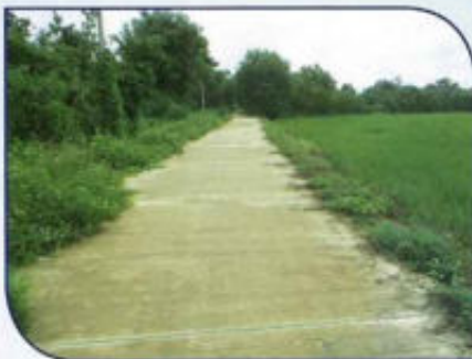
ก่อสร้างถนน คสล. หมู่ที่ 10 ต.ดงสุวรรณ เชื่อม ต.สันโค้ง (อบจ.พะเยา)