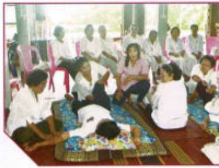
กิจกรรมโรงเรียนผู้สูงอายุอบรมอาชีพแก่ผู้สูงวัย