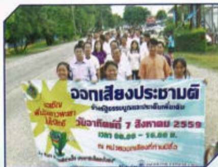
รณรงค์ประชาสัมพันธ์การออกเสียง ประชามติ