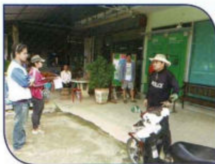
โครงการจัดทำแผนที่ภาษีและ ทะเบียนทรัพย์สิน