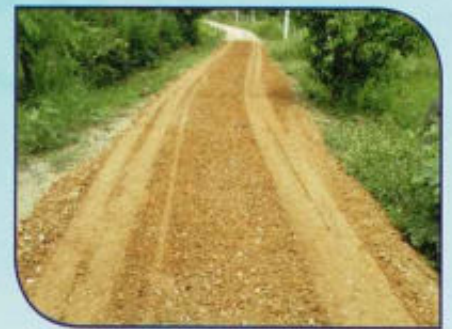
ปรับปรุงถนนโดยลงหินคลุก ภายในตำบล