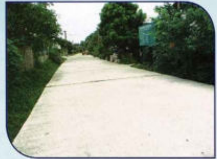
ก่อสร้างถนน คสล. หมู่ที่ 9