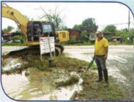
ช่วยเหลือผู้ประสบภัยน้ำท่วม