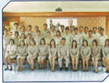
กิจกรรมวันท้องถิ่นไทย