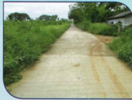
ก่อสร้างถนน คสล. หมู่ที่ 1, 2 เชื่อม ต.สันโค้ง (อบจ.พะเยา)