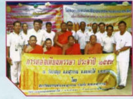
โครงการหล่อเทียนพรรษา