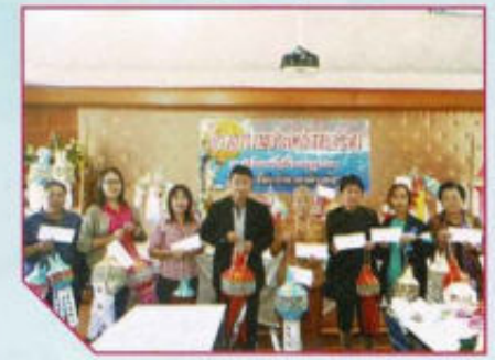
ประเพณีลอยกระทง