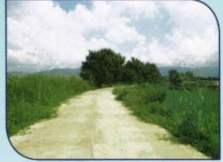
ก่อสร้างถนน คสล. หมู่ที่ 4 เชื่อม อ่างเก็บน้ำหนองขวาง (อบจ.พะเยา)