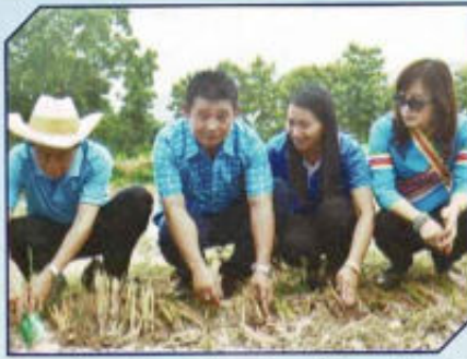
ปลูกป่า ปลูกหญ้าแฝกเฉลิมพระเกียรติ