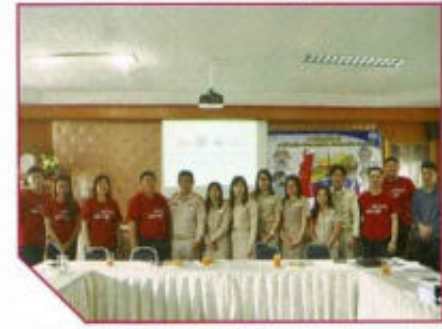
โครงการตำบลเครือข่ายสุขภาพ