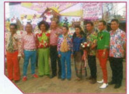
ร่วมงานดอกคำใต้เมืองคนงาม