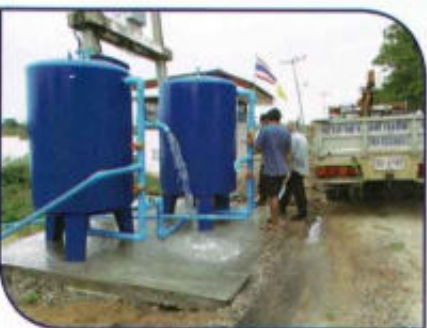
ปรับปรุงประปาหนองขวาง