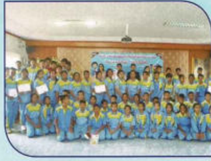
โครงการเยาวชนรุ่นใหม่ โตไปไม่โกง