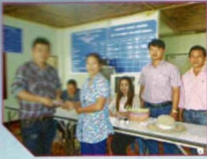
แจกเบียร์ยังชีพ