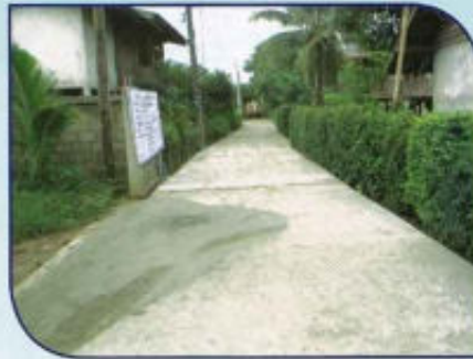
ก่อสร้างถนน คสล. หมู่ที่ 4