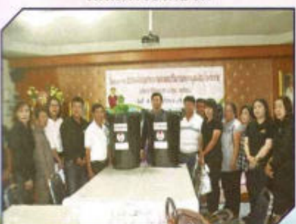
โครงการอบรมคัดแยกขยะและลด ปริมาณขยะมูลฝอยในชุมชน