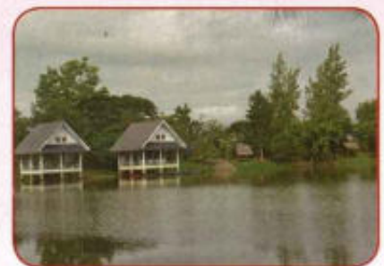
หนองขวาง แหล่งน้ำอุปโภคบริโภคที่สำคัญ หล่อเลี้ยงชีวิตของชาวตำบลดงสุวรรณ และพื้นที่ใกล้เคียง