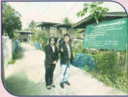
โครงการก่อสร้างถนน คสล. หมู่ที่ 3