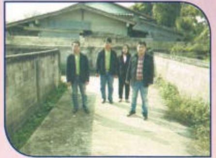
โครงการก่อสร้างถนน คสล. หมู่ที่ 3 ซอย 12 (บริเวณดงเจ้าบ้าน)