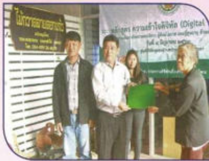
โครงการส่งเสริมการใช้ดิจิทัลอย่าง สร้างสรรค์และรับผิดชอบต่อสังคม