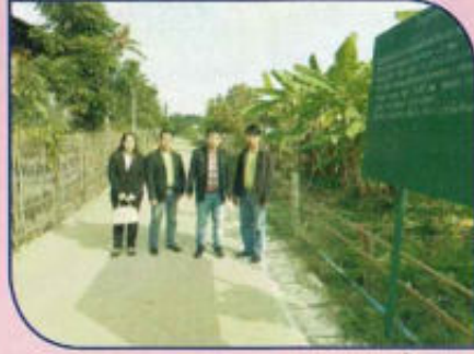
โครงการก่อสร้างวางระบายน้ำ คสล.แบบมีฝาปิดภายในหมู่บ้าน หมู่ที่ 1 ซอย 9 เชื่อม ซอย 11