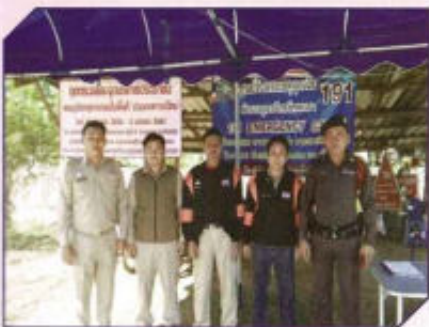
ตั้งด่านตรวจ 7 วัน อันตรายน