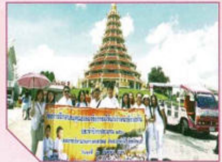
โครงการฝึกอบรมคุณธรรมจริยธรรม ให้แก่เจ้าหน้าที่ท้องถิ่น