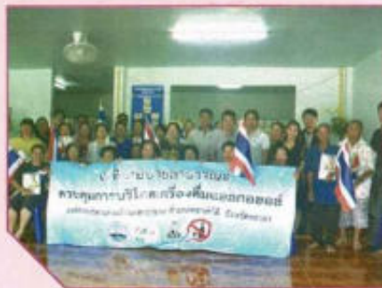
โครงการควบคุมการบริโภคเครื่องดื่ม แอลกอฮอล์ในระดับพื้นที่