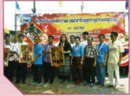
กิจกรรมสืบสานงานประเพณี สงกรานต์รดน้ำดำหัวผู้สูงอายุ