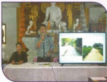
ประชามหมู่บ้านเพื่อเสนอ โครงการ