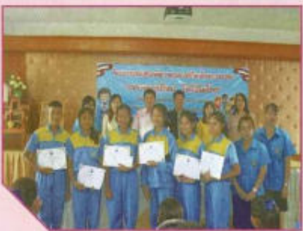
โครงการส่งเสริมคุณภาพชีวิตเด็ก และเยาวชน