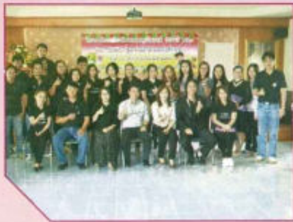
กิจกรรมองค์กร ดูแล ห่วงใย ใส่ใจป้องกันเอดส์ในที่ทำงาน