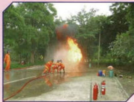
อบรม อปพร.