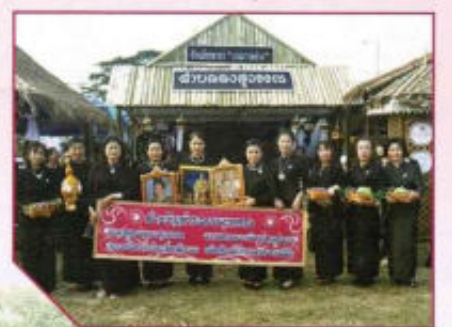
ร่วมกิจกรรมวันดอกคำใต้งาม