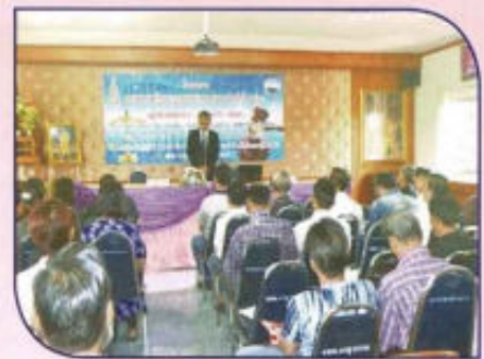
โครงการอบรมความรู้ทางกฎหมาย แก่ประชาชน