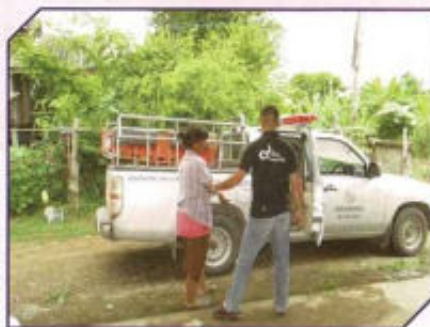
บริการรับส่งผู้ป่วย