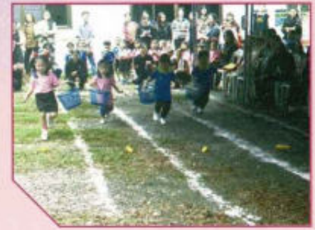
โครงการแข่งขันกีฬา ศูนย์พัฒนาเด็กเล็กบ้านดง