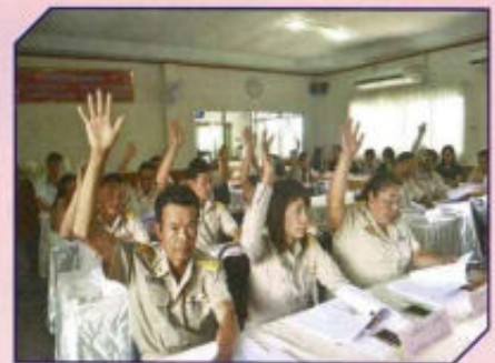
ประชุมสภาองค์การบริหารส่วน ตำบลดงสุวรรณ