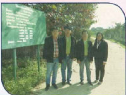
โครงการปรับปรุงซ่อมแซมถนน คสล. หมู่ที่ 5 (ซอย 22)