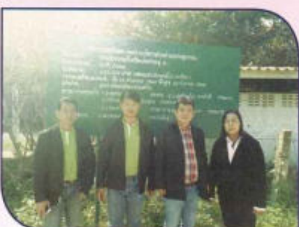
โครงการก่อสร้างวางระบายน้ำคอนกรีตเสริมเหล็กแบบไม่มีฝาปิดถนนหน้า อบต.ดงสุวรรณ - ถนนหน้า รพ.สต.ดงสุวรรณ