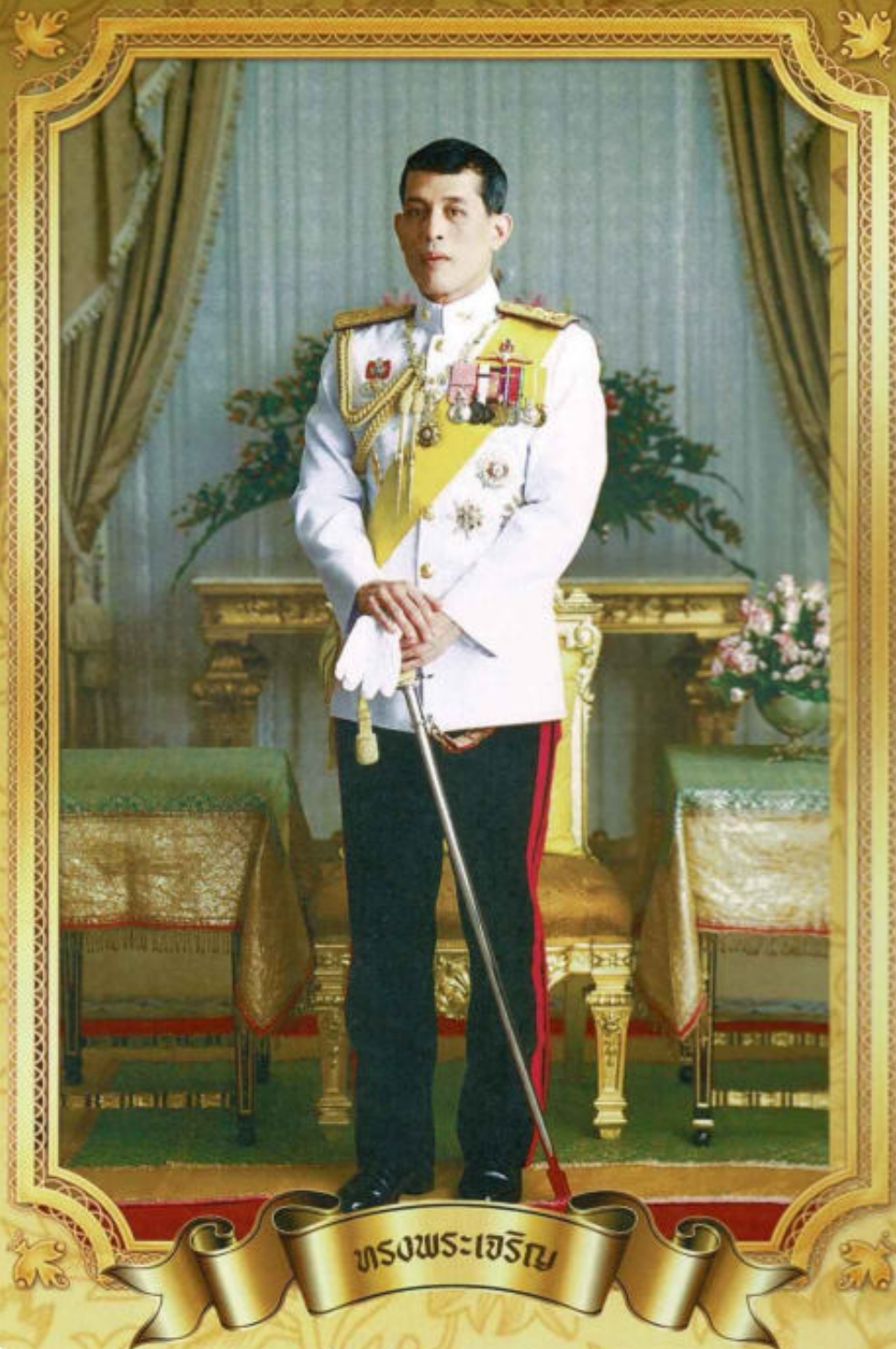
ทรงพระเจริญ

"งานราชการนั้น คืองานของแผ่นดิน มีผลเกี่ยวเนื่องโดยตรงถึงประโยชน์ของประเทศชาติและประชาชนทุกคน ดังนั้น ข้าราชการผู้ปฏิบัติบริหารงานของแผ่นดิน จึงต้องทำความเข้าใจถึงความสำคัญในหน้าที่ และความรับผิดชอบของตนให้ถ่องแท้ แล้วร่วมกันคิดร่วมกันทำด้วยความอุตสาหะ เสียสละ และด้วยความสุจริตจริงใจ โดยถือประโยชน์ที่จะเกิดจากงานเป็นหลักใหญ่ งานของแผ่นดินทุกส่วน จักได้ดำเนินก้าวหน้าไปพร้อมกัน และสำเร็จประโยชน์ที่พึงประสงค์ คือ ยังความเจริญมั่นคงให้เกิดแก่ประเทศชาติและประชาชนได้แท้จริงและยั่งยืนตลอดไป"