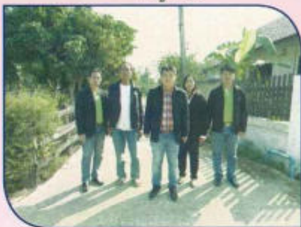
โครงการก่อสร้างถนน คสล. หมู่ที่ 4 (ซอย 16)