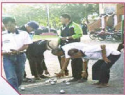
โครงการออกกำลังกายเล่นกีฬาเสริมสร้างสุขภาพ