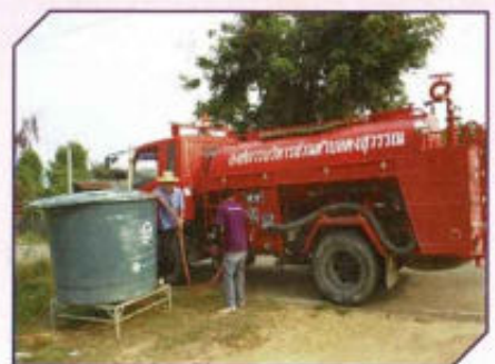
บริการส่งน้ำอุปโภค-บริโภค