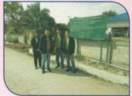
โครงการก่อสร้างวางระบายน้ำ คสล. หมู่ที่ 4 ซอย 16