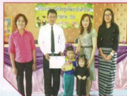
พิธีมอบประกาศนียบัตรศูนย์พัฒนาเด็กเล็กบ้านจาง