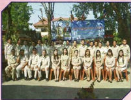
โครงการวันท้องถิ่นไทย