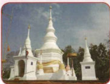
พระธาตุดงสุวรรณบรรพตและพระธาตุภูแฉ่ เป็นโบราณสถานที่เก่าแก่และศักดิ์สิทธิ์ของตำบลดงสุวรรณ เป็นที่เคารพสักการบูชาของประชาชนทั่วไป