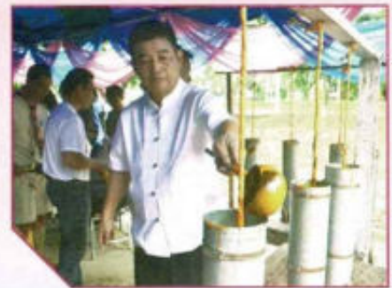
โครงการหล่อเทียนพรรษา