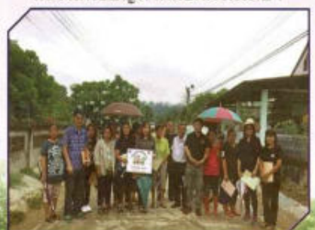
โครงการบ้านประดับดาว