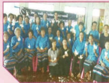
โครงการเสริมสร้างศักยภาพสตรี