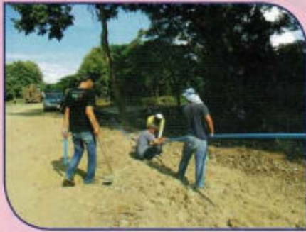
ซ่อมแซมประปา