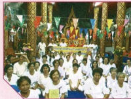
โครงการทำวัตรสัจจรต่าบลดงสุวรรณ ลดละเลิกเหล้า เข้าวัดปฏิบัติธรรม