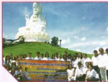
โครงการฝึกอบรมคุณธรรม จริยธรรมให้แก่เจ้าหน้าที่ท้องถิ่น