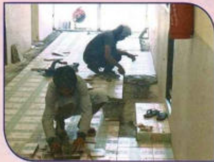
ปรับปรุงอาคารศูนย์พัฒนาเด็กเล็ก