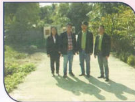
โครงการก่อสร้างถนน คสล. หมู่ที่ 6