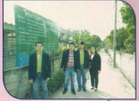
โครงการก่อสร้างวางระบายน้ำ คสล. ในหมู่บ้าน หมู่ที่ 2