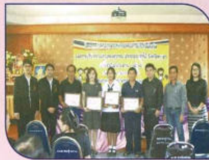
โครงการรักษาดีถูกทาง สร้างเสริม ความซื่อสัตย์สุจริต