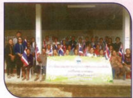
ฝึกอบรมพัฒนาคุณภาพและบูรณาการ แผนชุมชนและพัฒนาท้องถิ่นประจำปี