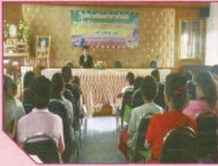
โครงการแก้ไขปัญหาคือ ความรุนแรงในครอบครัว