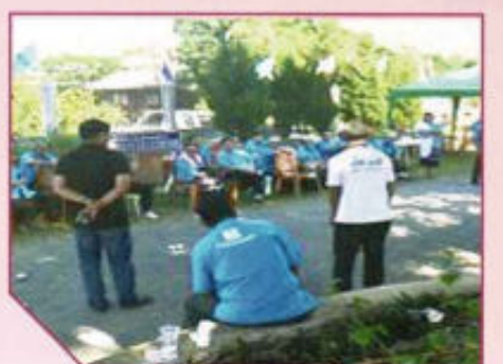
โครงการออกกำลังกายเล่นกีฬาเสริมสร้างสุขภาพ