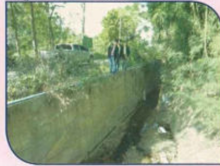
โครงการก่อสร้างผนังกันน้ำ คสล.หมู่ที่ 4