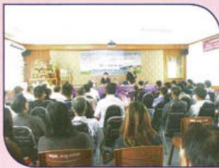
โครงการฝึกอบรมให้ความรู้แก่ประชาชน ที่ร่วมเป็นคณะกรรมการจัดซื้อจัดจ้าง