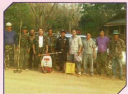
ดับไฟป่า