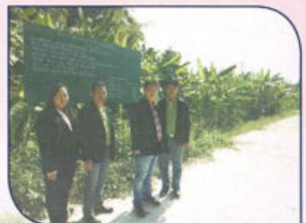
โครงการก่อสร้างถนนคอนกรีตเสริมเหล็ก หมู่ที่ 6 ซอยข้างวัดกองแล