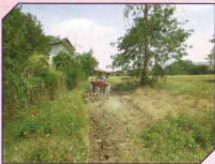
ก่อสร้างแนวกันไฟป่า