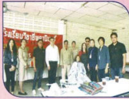
โครงการ อบต.สัญญา พบประชาชน