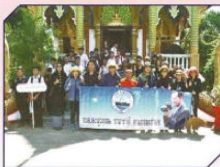
โครงการ อด.ตงสุวรรณ อาสาทำดี ตามรอยพ่อ