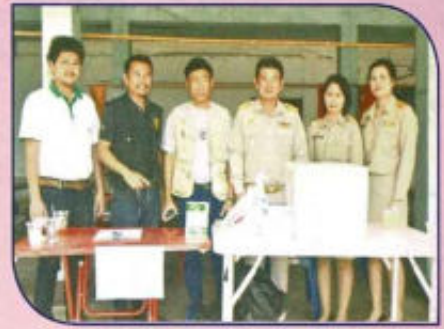
โครงการ อบต.สัญญา พบประชาชน