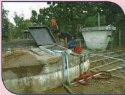
ปรับปรุงระบบประปา