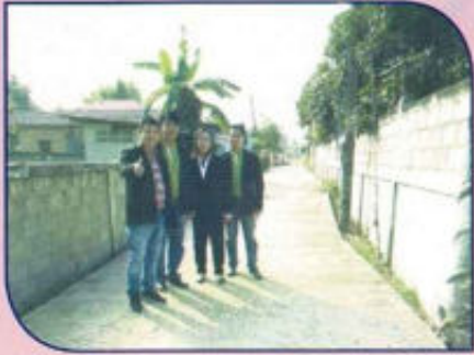
โครงการก่อสร้างถนน คสล. หมู่ที่ 1