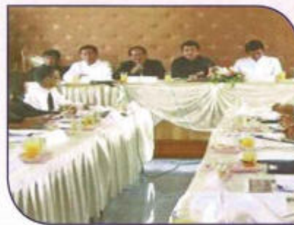
ประชุมคณะกรรมการประสานแผน พัฒนาท้องถิ่นระดับอำเภอออกค่าได้