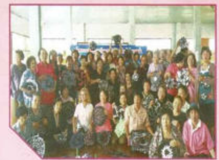
โครงการอบรมฝึกอาชีพ