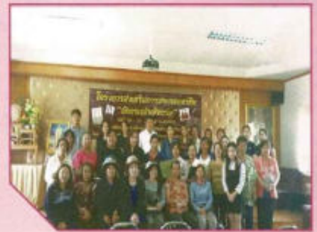
โครงการส่งเสริมการประกอบอาชีพ