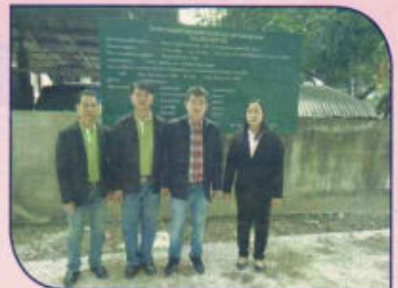
โครงการก่อสร้างถนนคอนกรีตเสริมเหล็ก หมู่ที่ 10