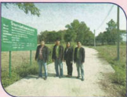
โครงการก่อสร้างถนน คสล. หมู่ที่ 11