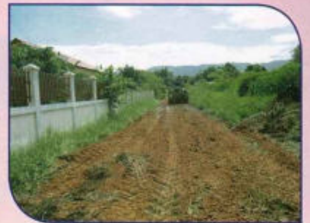
ปรับปรุงถนนสู่พื้นที่การเกษตร