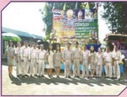
กิจกรรมปรองดอง สมานฉันท์ คืนความสุขให้ประชาชน