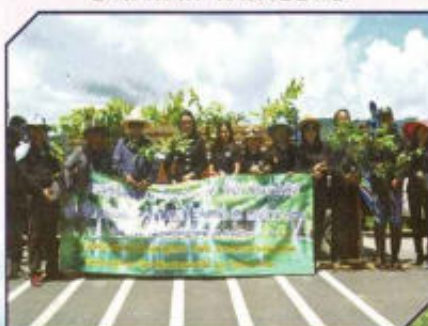
โครงการอนุรักษ์ทรัพยากรน้ำและป่า