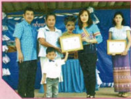
กิจกรรมวันแม่แห่งชาติ