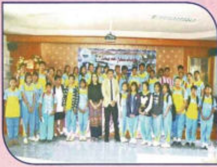
โครงการ รู้แก่ รู้กัน รู้เท่าทัน เทคโนโลยี