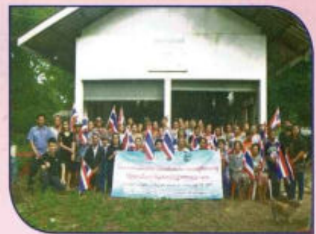
โครงการวิจัยชุมชน recap