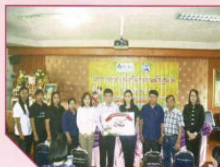
โครงการอบรมส่งเสริมสุขภาพเด็กปฐมวัย