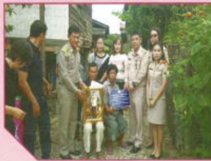
โครงการซ่อมแซมบ้านผู้ยากไร้