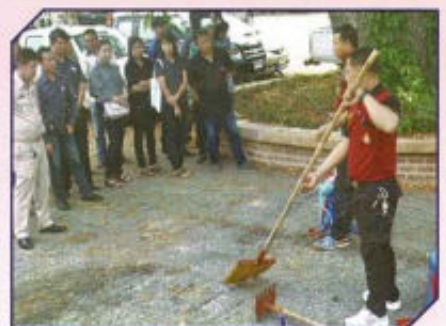
โครงการรณรงค์ป้องกัน และแก้ไขปัญหาหมอกควันไฟป่า