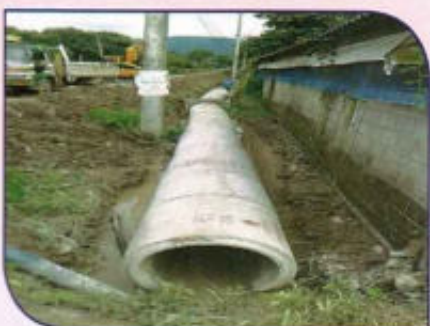
โครงการก่อสร้างวางระบายน้ำคอนกรีตเสริมเหล็กแบบไม่มีฝาปิดถนนหน้า อบต.ดงสุวรรณ-ถนนหน้า รพ.สต.ดงสุวรรณ