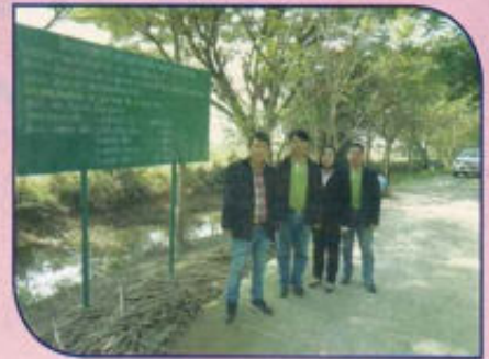
โครงการก่อสร้างถนน คสล. หมู่ที่ 7