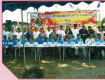
กิจกรรมสืบสานงานประเพณี สงกรานต์รดน้ำดำหัวผู้สูงอายุ