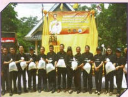
กิจกรรมปล่อยพันธุ์สัตว์น้ำ เฉลิมพระเกียรติ