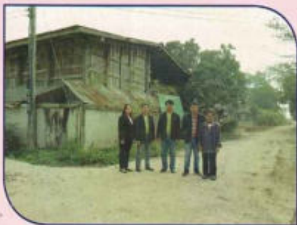
โครงการก่อสร้างถนนคอนกรีตเสริมเหล็ก หมู่ที่ 10