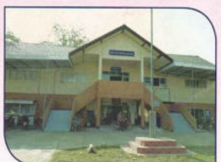
โครงการปรับปรุงอาคารสำนักงาน