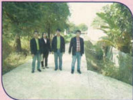
โครงการก่อสร้างถนนคอนกรีตเสริมเหล็ก หมู่ 8 ซอย 21