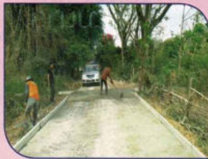
โครงการก่อสร้างถนน คสล. หมู่ที่ 7