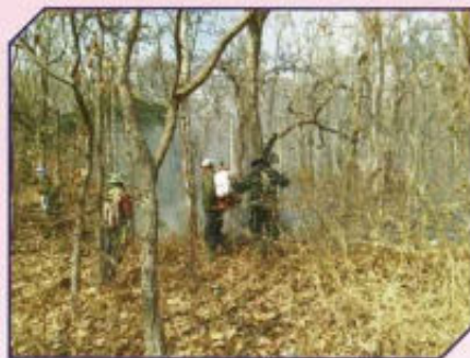
ดับไฟป่า