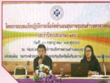
โครงการอบรมเชิงปฏิบัติการเพื่อจัดทำแผนสุขภาพชุมชนตำบลลงสุวรรณ