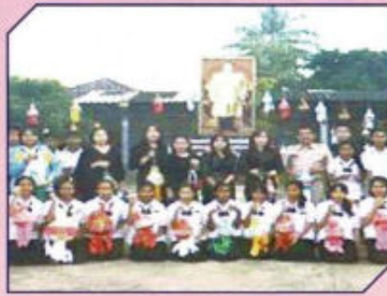
โครงการประทีปโคมไฟเพื่อแสดงความอาลัย และกิจกรรมถวายเป็นพระราชกุศลฯ