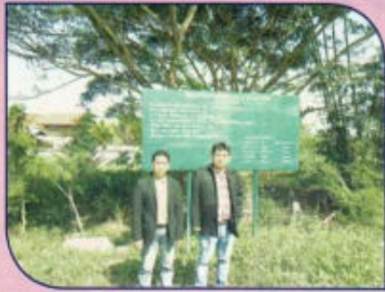
โครงการขุดวางระบายน้ำพร้อมวางท่อระบายน้ำ คสล. หมู่ที่ 7 ซอยข้างวัดสุขเกษม