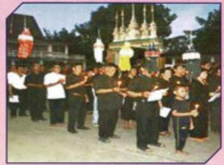
โครงการประทีปโคมไฟเพื่อแสดงความอาลัย และกิจกรรมถวายเป็นพระราชกุศลฯ