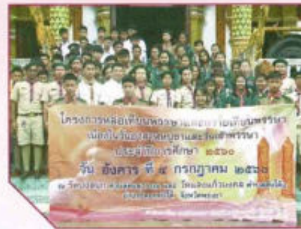
โครงการหล่อเทียนพรรษา