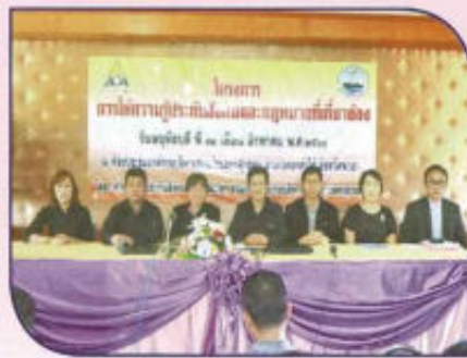
โครงการให้ความรู้ประกันสังคม และกฎหมายที่เกี่ยวข้อง