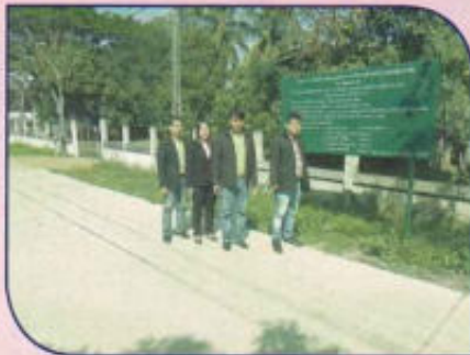
โครงการก่อสร้างถนนคอนกรีตเสริมเหล็ก หมู่ที่ 9 ซอย 24