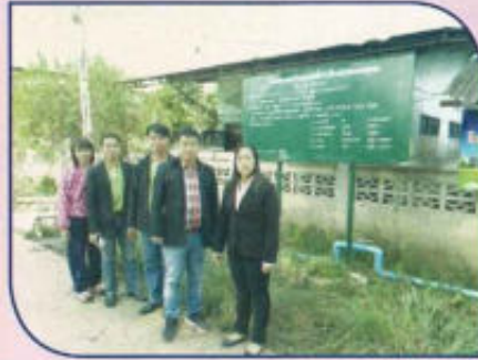
โครงการปรับปรุงระบบประปาหมู่บ้าน หมู่ที่ 3 (เดินท่อเมนจ่ายน้ำประปา)