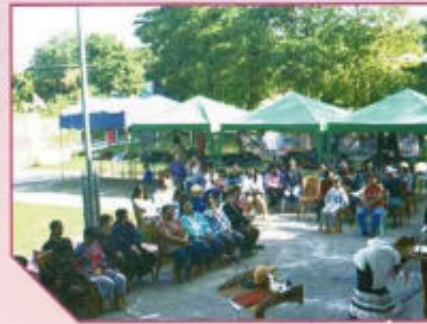
โครงการ กาดนัดเอื้ออาทร เพื่อพี่น้องดงสุวรรณ