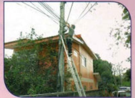
ปรับปรุงซ่อมแซมไฟฟ้าส่องสว่าง