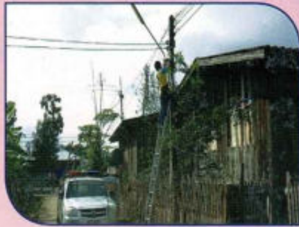
ติดตั้งไฟฟ้าส่องสว่าง