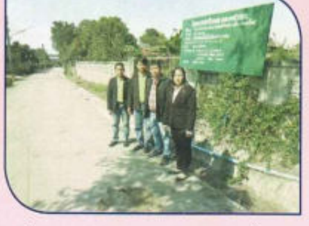
โครงการก่อสร้างวางระบายน้ำ คสล. ในหมู่บ้าน หมู่ที่ 11