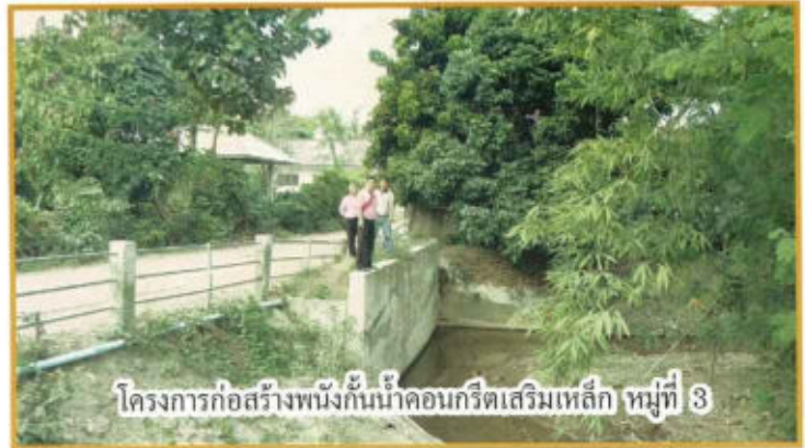
โครงการก่อสร้างพังกันน้ำคอนกรีตเสริมเหล็ก หมู่ที่ 3