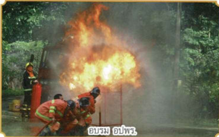
อบรม อปพร.