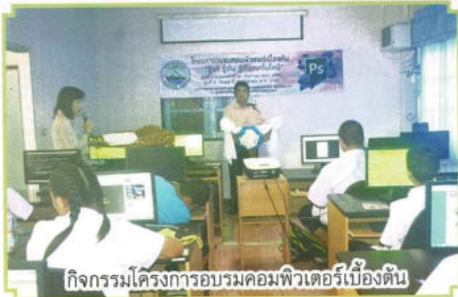
กิจกรรมโครงการอบรมคอมพิวเตอร์เบื้องต้น