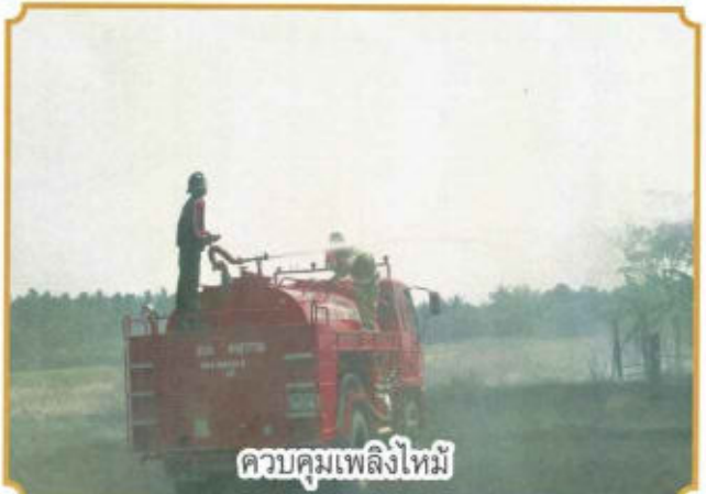
ควบคุมเพลิงไหม้