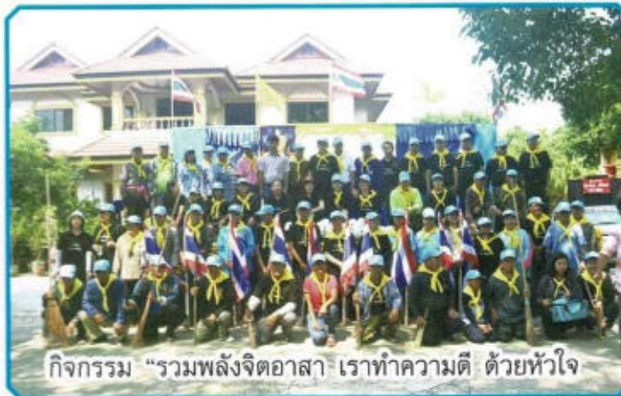
กิจกรรม "รวมพลังจิตอาสา เราทำความดี ด้วยหัวใจ"