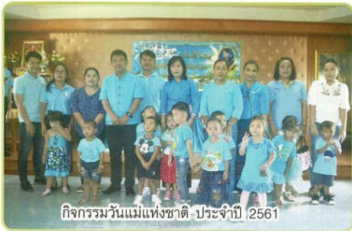
กิจกรรมวันแม่แห่งชาติ ประจำปี 2561