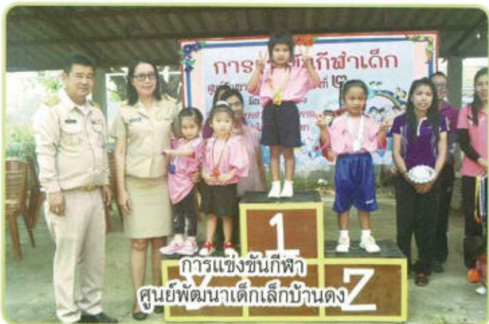
การแข่งขันกีฬา ศูนย์พัฒนาเด็กเล็กบ้านดง