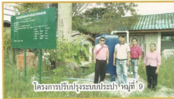
โครงการปรับปรุงระบบประปา หมู่ที่ 9