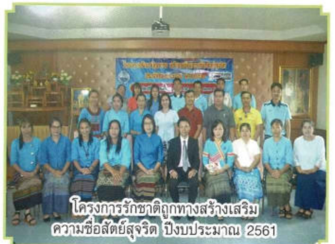
โครงการรักษาดีถูกทางสร้างเสริม ความซื่อสัตย์สุจริต ปีงบประมาณ 2561