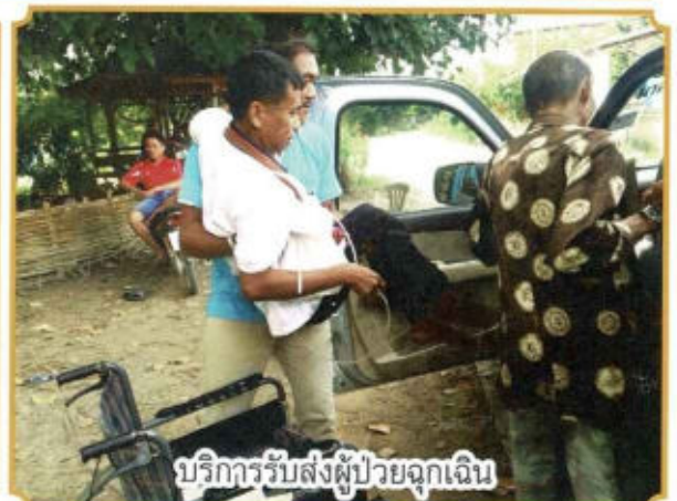
บริการรับส่งผู้ป่วยฉุกเฉิน