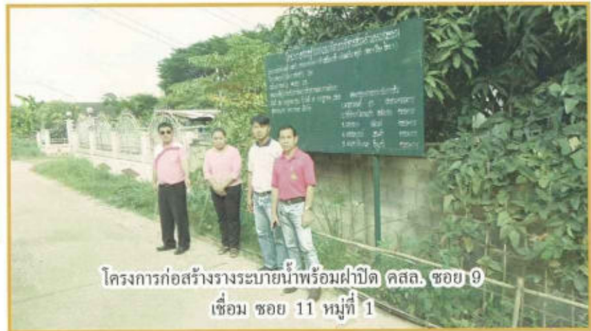
โครงการก่อสร้างรางระบายน้ำพร้อมฝาปิด คสล. ซอย 9 เชื่อม ซอย 11 หมู่ที่ 1