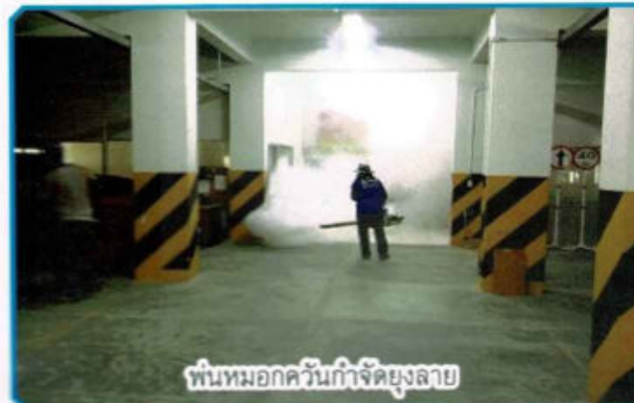
พื้นหมอกคว้นกำจัดขุยลอย