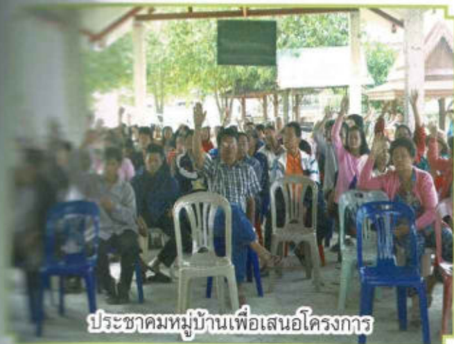
ประชามหมู่บ้านเพื่อเสนอโครงการ