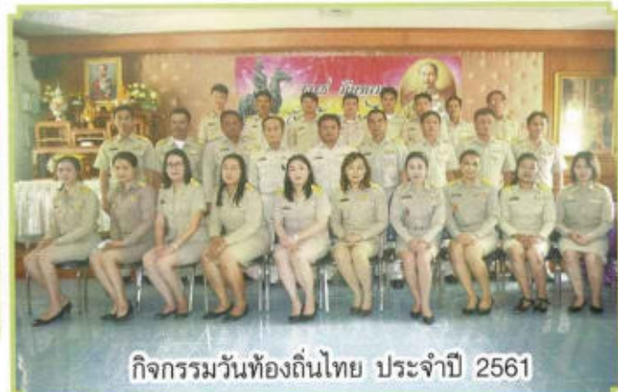
กิจกรรมวันท้องถิ่นไทย ประจำปี 2561