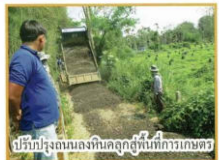
ปรับปรุงถนนลงหินคลุกสู่พื้นที่การเกษตร