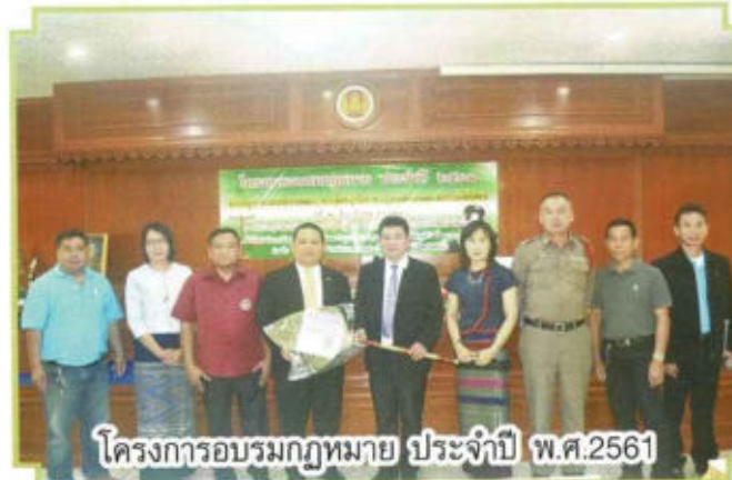
โครงการอบรมกฎหมาย ประจำปี พ.ศ.2561