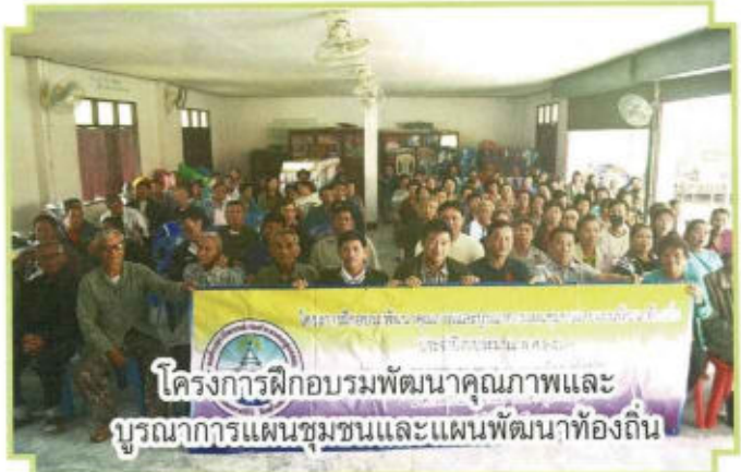
โครงการฝึกอบรมพัฒนาคุณภาพและบูรณาการแผนชุมชนและแผนพัฒนาท้องถิ่น