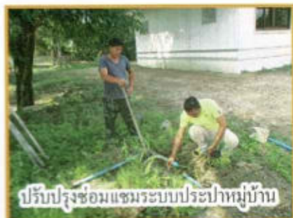
ปรับปรุงซ่อมแซมระบบประปาหมู่บ้าน