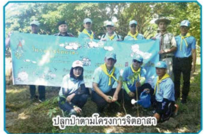
ปลูกป่าตามโครงการจิตอาสา