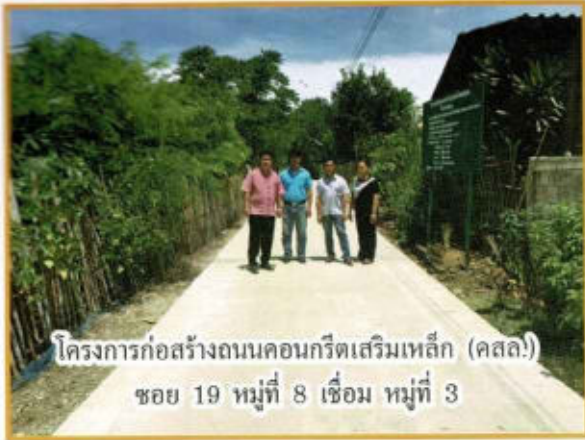
โครงการก่อสร้างถนนคอนกรีตเสริมเหล็ก (คสล.) ซอย 19 หมู่ที่ 8 เชื่อม หมู่ที่ 3