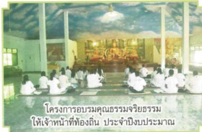
โครงการอบรมคุณธรรมจริยธรรมให้เจ้าหน้าที่ท้องถิ่น ประจำปีงบประมาณ