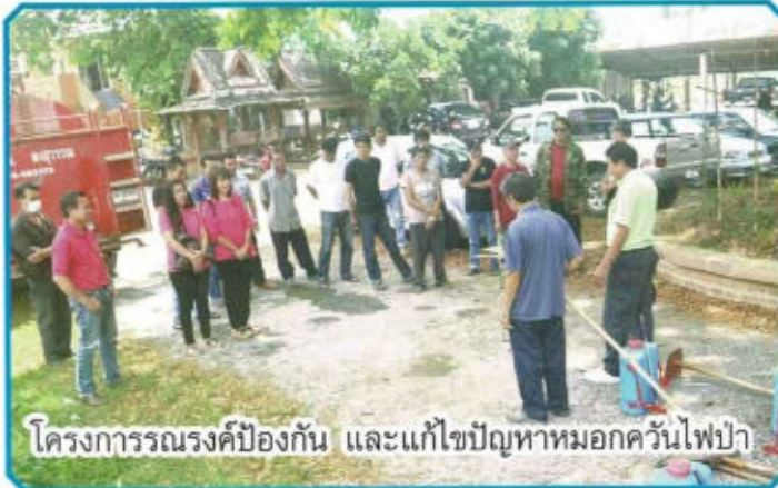
โครงการรณรงค์ป้องกัน และแก้ไขปัญหามอกคว้นไฟฟ้า