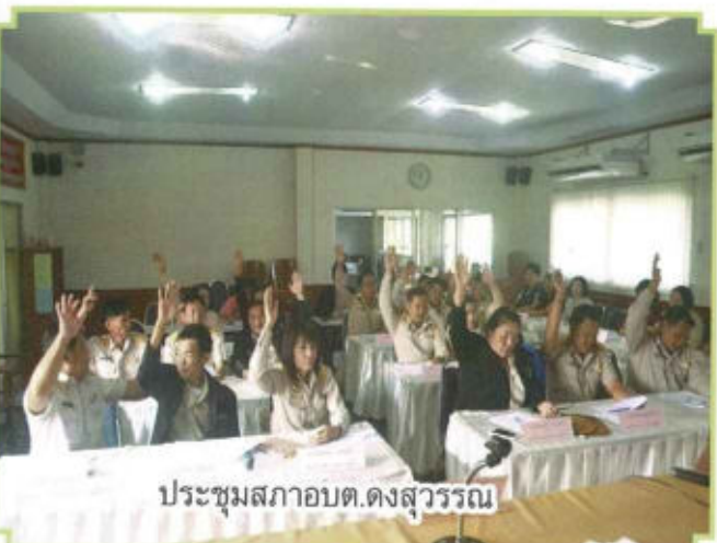
ประชุมสภาอบต.ดงสุวรรณ