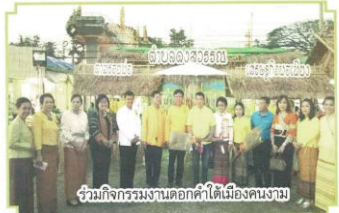
ร่วมกิจกรรมงานดอกคำใต้เมืองคนงาม