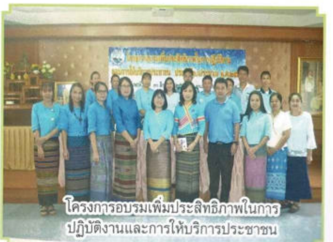
โครงการอบรมเพิ่มประสิทธิภาพในการ ปฏิบัติงานและการให้บริการประชาชน