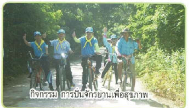
กิจกรรม การปั่นจักรยานเพื่อสุขภาพ