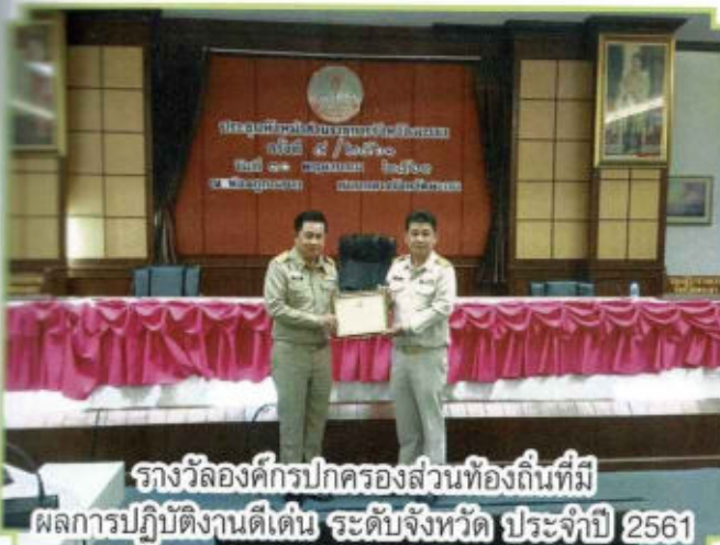
รางวัลองค์กรปกครองส่วนท้องถิ่นที่มี ผลการปฏิบัติงานดีเด่น ระดับจังหวัด ประจำปี 2561