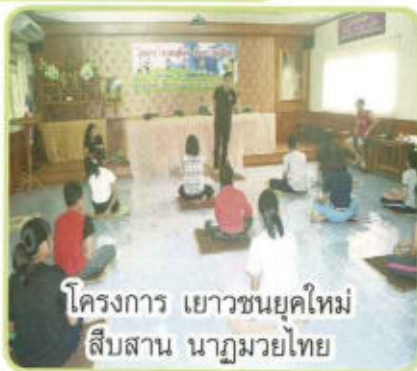
โครงการ เยาวชนยุคใหม่ สืบสาน นาฏมวยไทย