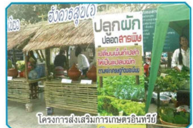
โครงการส่งเสริมการเกษตรอินทรีย์