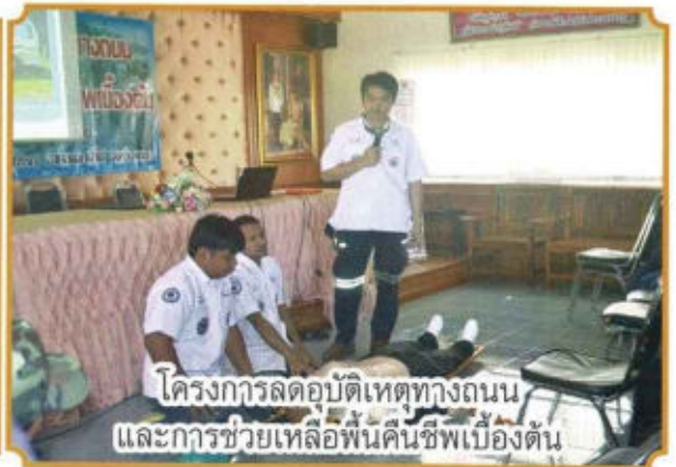
โครงการลดอุบัติเหตุทางถนน และการช่วยเหลือฟื้นคืนชีพเบื้องต้น