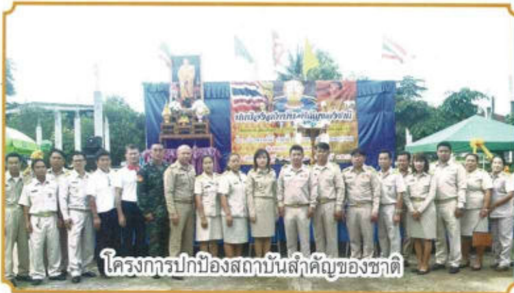
โครงการปกป้องสถาบันสำคัญของชาติ