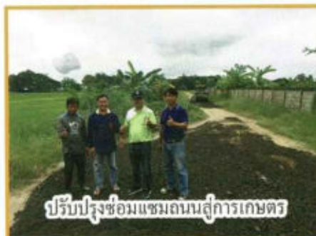
ปรับปรุงซ่อมแซมถนนสู่การเกษตร