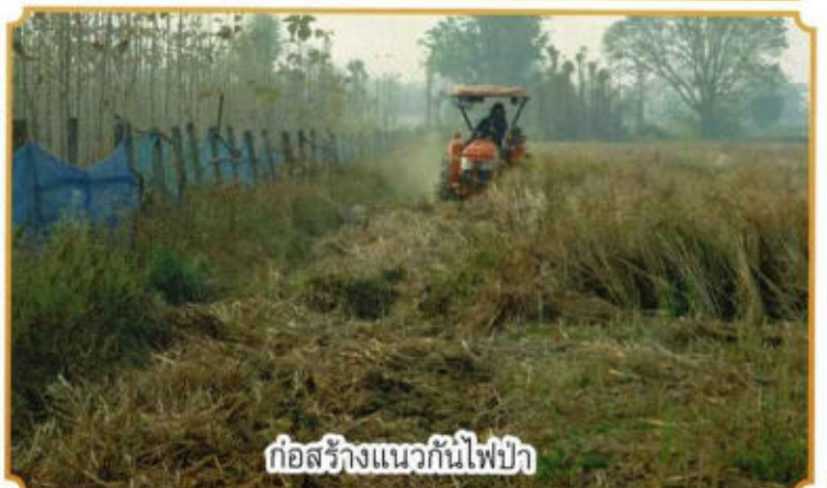
ก่อสร้างแนวกันไฟฟ้า