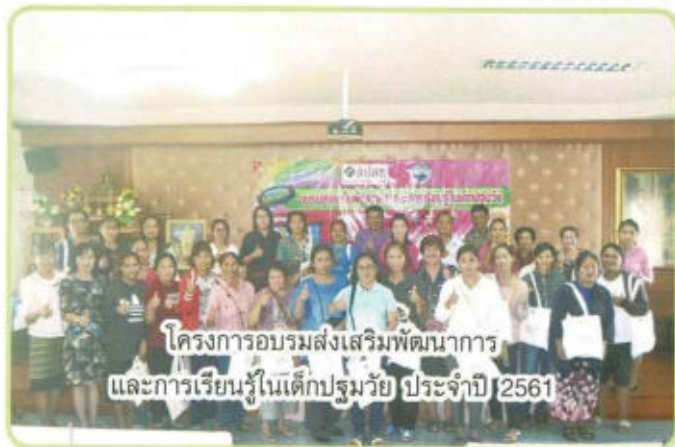
โครงการอบรมส่งเสริมพัฒนาการ และการเรียนรู้ในเด็กปฐมวัย ประจำปี 2561