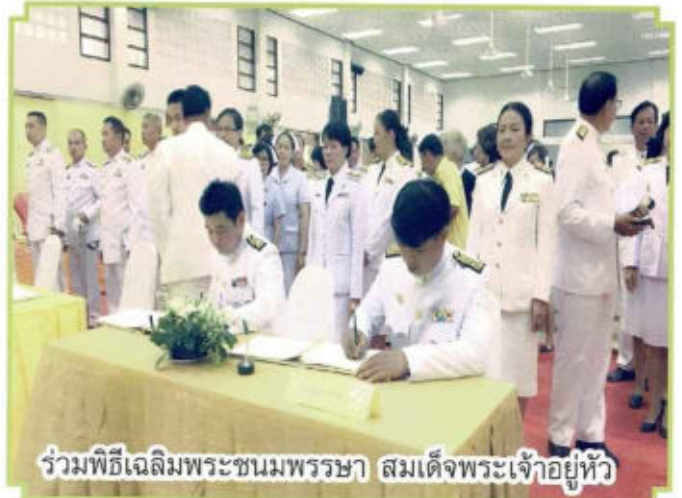
ร่วมพิธีเฉลิมพระชนมพรรษา สมเด็จพระเจ้าอยู่หัว