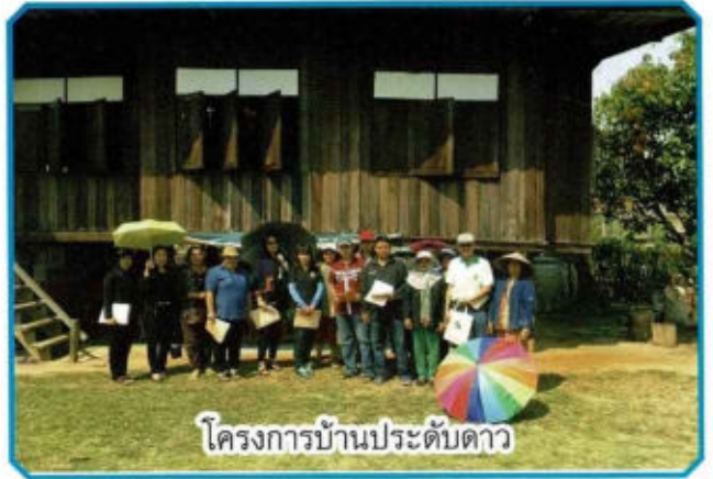
โครงการบ้านประดับดาว