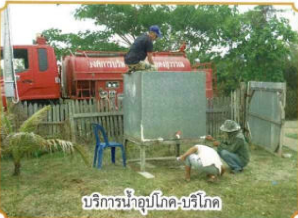
บริการน้ำอุปโภค-บริโภค