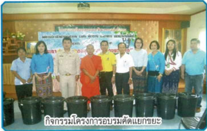
กิจกรรมโครงการอบรมคัดแยกขยะ