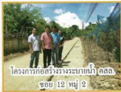
โครงการก่อสร้างรางระบายน้ำ คสล. ซอย 12 หมู่ 2