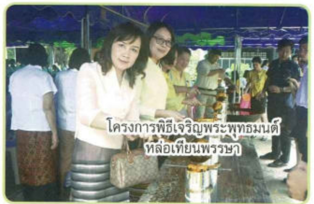
โครงการพิธีเจริญพระพุทธมนต์ หล่อเทียนพรรษา