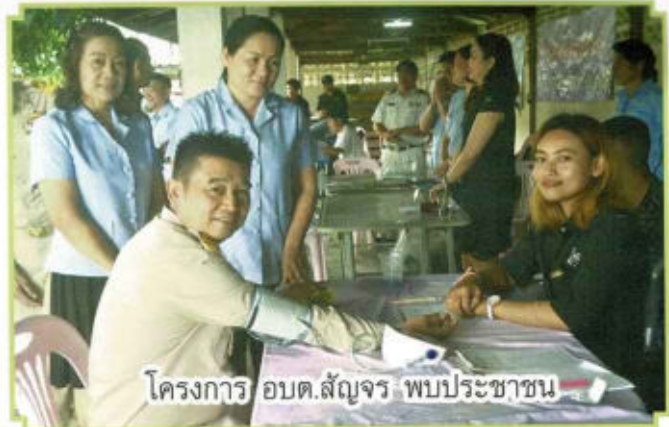
โครงการ อบต.สัญจร พบประชาชน