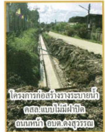
โครงการก่อสร้างรางระบายน้ำ คสล.แบบไม่มีฝาปิด ถนนหน้า อบต.ดงสุวรรณ