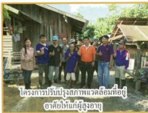
โครงการปรับปรุงสภาพแวดล้อมที่อยู่ อาศัยให้แก่ผู้สูงอายุ