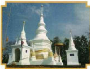
พระธาตุดงสุวรรณบรรพตและพระธาตุแก้ว

เป็นโบราณสถานที่เก่าแก่และศักดิ์สิทธิ์ของตำบลดงสุวรรณ เป็นที่เคารพสักการบูชาของประชาชนทั่วไป