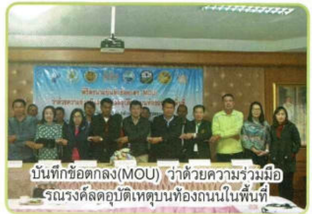
บันทึกข้อตกลง(MOU) ว่าด้วยความร่วมมือ รณรงค์ลดอุบัติเหตุบนท้องถนนในพื้นที่