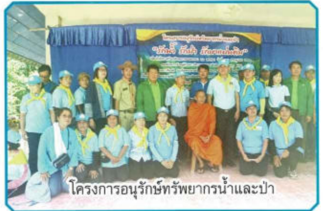
โครงการอนุรักษ์ทรัพยากรน้ำและป่า