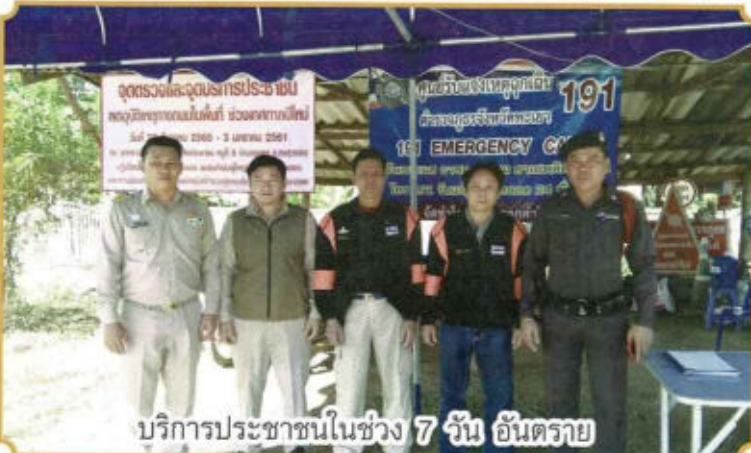
บริการประชาชนในช่วง 7 วัน อันตรัย