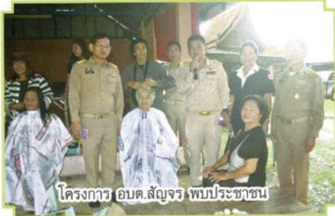
โครงการ อบต.สัญจร พบประชาชน