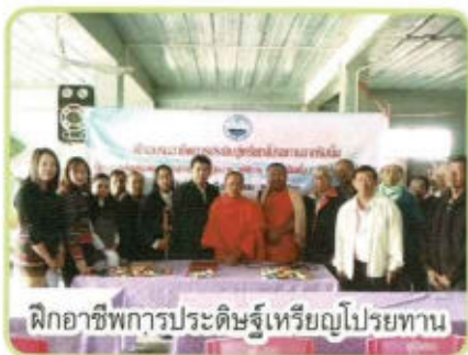
ฝักอาชีพการประดิษฐ์เหรียญไปรษณีย์