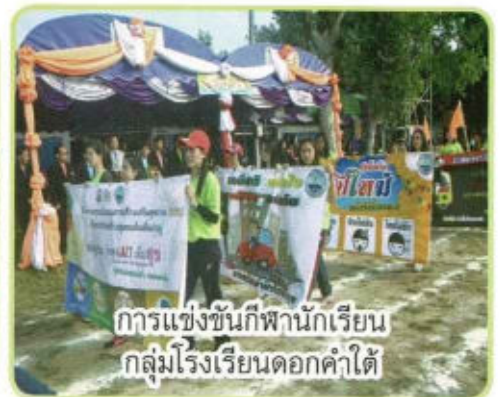
การแข่งขันกีฬานักเรียน กลุ่มโรงเรียนดอกคำใต้